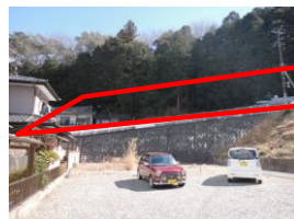
← 赤枠が土地が対象不動産